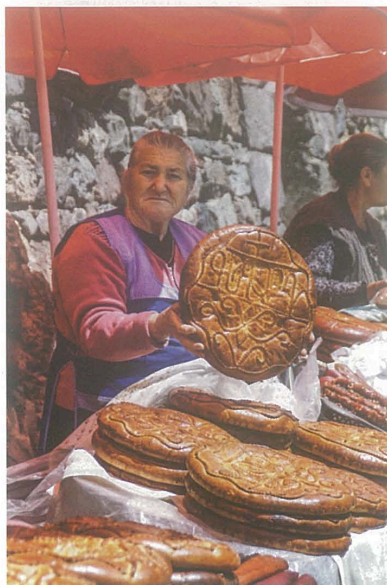
BRIOCHE DE PÂQUES.